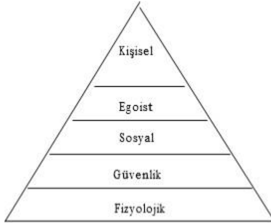
Şekil 1. McGregor'un Çalışan Motivasyonu Hiyerarşisi (McGregor, 1957)

NOT: Tez yazımı için kullanılacak güncel şablon: